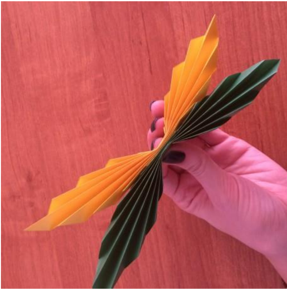
8. Расправляем крылья бабочки: