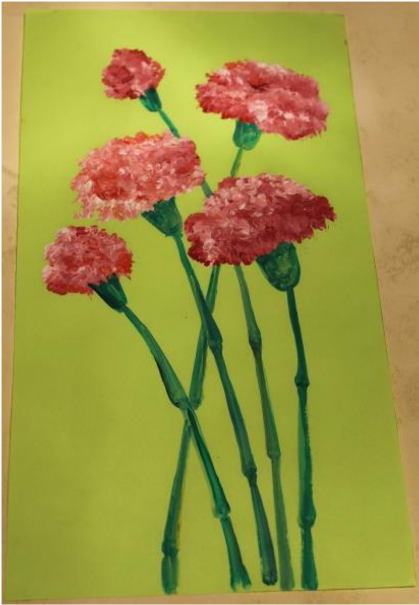
5. Рисуем листики .