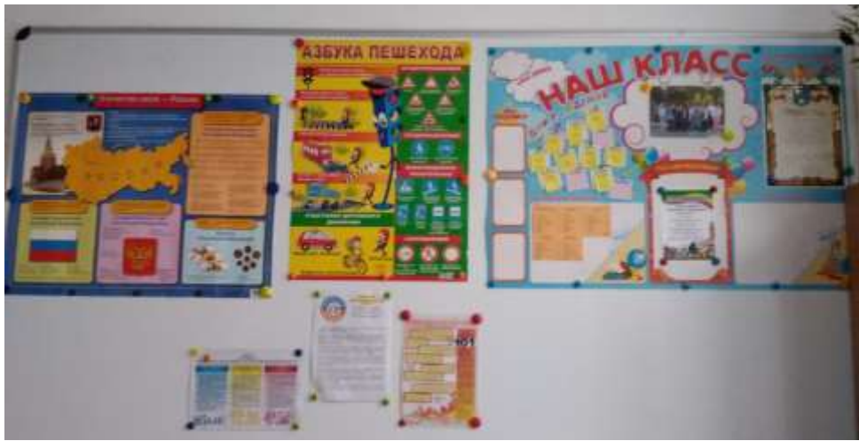
Обязательный уголок с информацией по правилам техники безопасности.